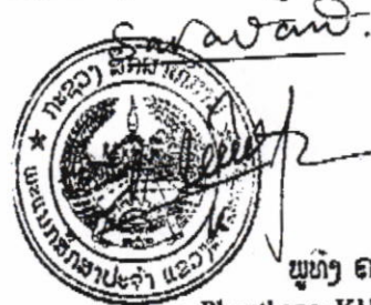
ພູທັງ ຄຳມະນີວິງ Phouthong KHAMMANEVONG