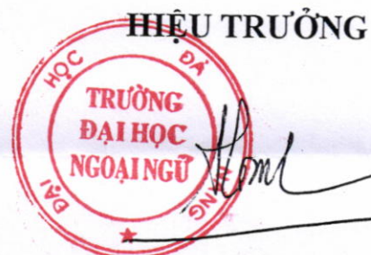
TS. TRẦN HỮU PHÚC